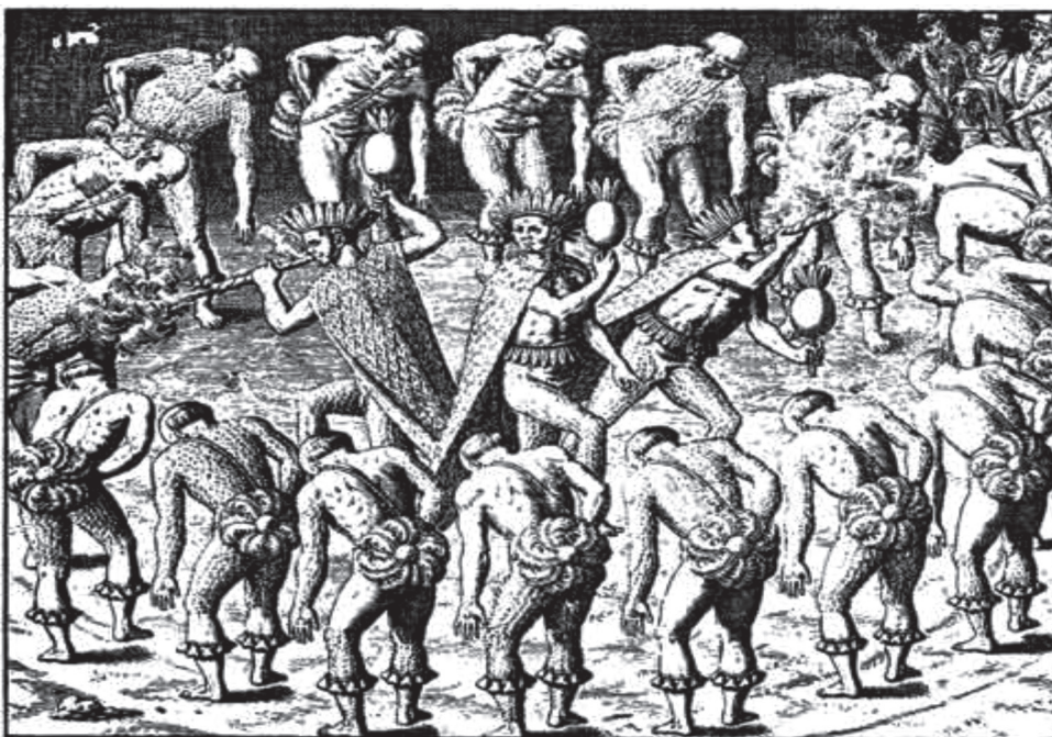
Figura 4. Areíto

Una correcta valoración de las Leyes de Burgos no puede obviar la consideración de algunos artículos que avalan o sancionan determinados aspectos de la cultura indígena. Particularmente significativos son los artículos 12 [14] que permite la realización de los areitos y el 20 [22] que confiere ciertas prerrogativas a los caciques. En este último caso, es evidente que se trata de una política estratégica que busca facilitar el control de la masa indígena apelando a la autoridad de que gozaban las élites autóctonas 78 . Más problemática se presenta la explicación del artículo 12 79 . Por él se ordena que no se impida a los indios realizar sus