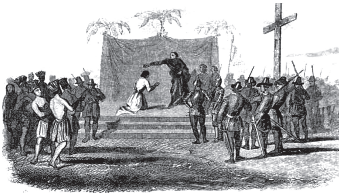
Figura 3. Cristianización voluntaria. Bajo la atenta mirada de los conquistadores...

artículos de fe y otras cosas de la doctrina; pero la enseñanza de los rudimentos corría a cargo de los encomenderos.