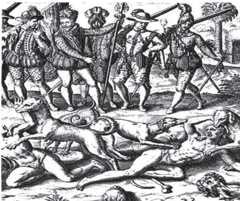
Figura 5. Cristianos aperreando indios