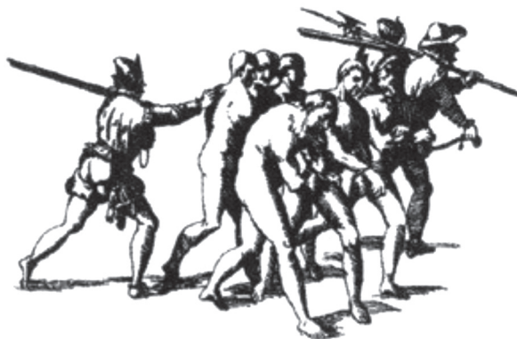
Figura 1. ‘Montería’ de indios 22 .

Así que, so color de que en las ‘yslas ynutils’ había exceso de indios que, además de ociosos, se perdían los beneficios de la cristianización, de modo que de ellos “ningund provecho se espera”, el muy católico Fernando dio luz verde al asolamiento de la cuenca caribe del continente. Y aunque el rey ordenó que aquello se hiciese con el “menos escándalo [que] se pudiese hacer”, lo cierto es que se desataron auténticas cacerías humanas instigadas por el propio rey 20 . La caza y distribución en masa de piezas humanas ‘inútiles’ para convertirlas en útiles en las minas y empresas de La Española se volvió en un negocio tan lucrativo que en él participaban funcionarios del más alto rango como Vásquez de Ayllón 21 .