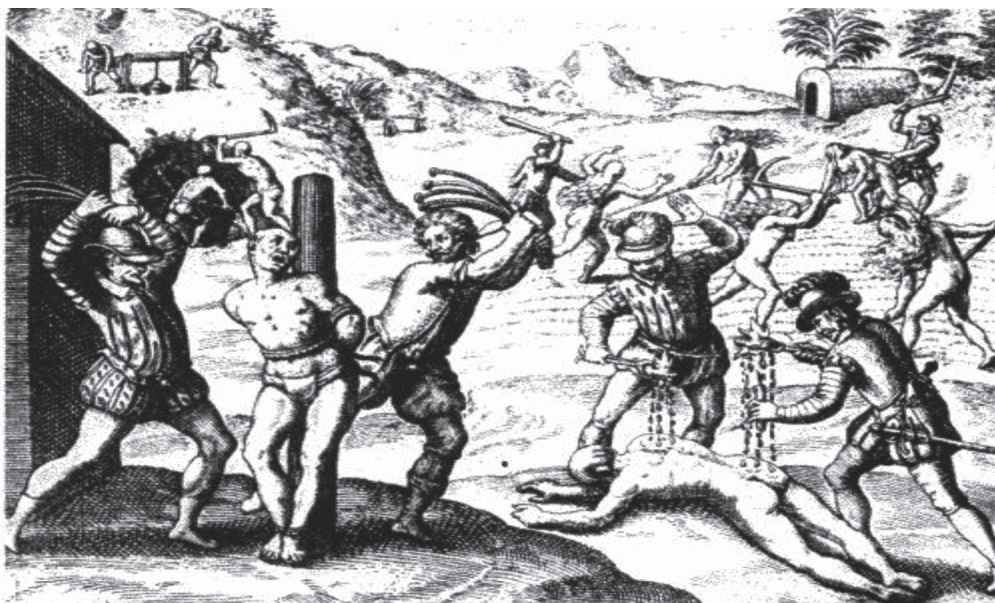
Figura 2. En las minas de oro. Castigo de los trabajadores indios.

‘descanso’ con un control estricto y por escrito de las entradas y salidas. Durante el período de descanso los mineros sólo podrían utilizar esclavos y dedicarse, bajo la supervisión de los oficiales reales, a la fundición del metal. Este artículo debe verse en relación con la R.C. del 06-06-1511 por la que se habían reducido los plazos de la demora para aumentar la productividad del trabajo ( vid supra ). Aun así, no sabemos cuál regulación de la demora se aplicó finalmente. Las Casas, testigo presencial de estos sucesos pues todavía era un encomendero más, certifica que “cada demora duraba ocho o diez meses” 62 . Este elemento de la aplicación discrecional de las normas impide un análisis relevante de la demora centrado en la hermenéutica del Derecho.